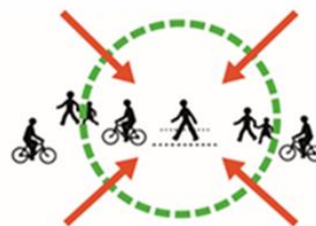
Finmasket nett for gående og syklende.